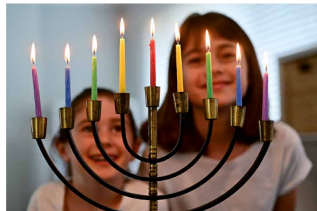
Gottes Segen kommt durch Israel zu uns

Aus diesem Ölbaum hat Gott nun „einige Zweige ausgebrochen“ (Römer 11,17). Gemeint sind die Juden, die den Glauben der Väter verlassen haben und anderen Göttern nachgefolgt sind, so wie es zur Zeit des Propheten Elia der Fall war (1. Könige 19,18). An die Stelle der ausgebrochenen Zweige wurden nun wir Christen aus allen Völkern, die wir an den Christus, den Messias Jesus glauben, als „wilder Ölweig“ in den Ölbaum eingepflanzt.