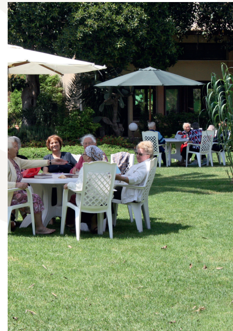
Begegnung unter Holocaustüberlebenden

In unserem Gästehaus bekommen Überlebende des Holocaust seit 1969 die Möglichkeit, einen kostenlosen Urlaub am Mittelmeer zu verbringen. Dazu werden sie in Gruppen von jeweils 41 Personen für zehn Tage eingeladen. Jährlich sind das rund 500 Gäste.