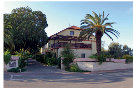
Beth El – Gästehaus in Shavei Zion