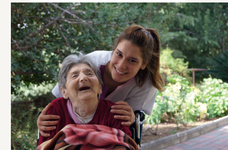
Liebevolle Zuwendung über die Pflege hinaus