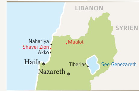
ZEDAKAH-Standorte (rot) in Israels Norden

In unserem Pflegeheim in Maalot werden seit 1984 pflegebedürftige Juden, die den Nationalsozialismus überlebt haben, gepflegt und umsorgt. Dazu stehen 24 begehrte Pflegeplätze zur Verfügung. Das Wort „Elieser“ bedeutet „mein Gott ist Hilfe“. Diese Hilfe sollen die Bewohner durch praktische Nächstenliebe persönlich erfahren.