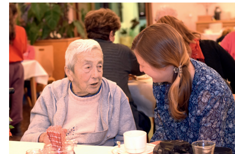
Heimbewohnerin und Mitarbeiterin beim Kaffeetrinken

Auf Wunsch erhalten Sie gerne unseren separaten Hausprospekt und das aktuelle Jahresprogramm.