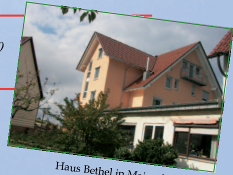
Haus Bethel in Maisenbach

Ausflug nach Offenburg, Abfahrt ca. 12:00 Uhr Führung „Jüdisches Offenburg“ Abendessen in Offenburg. Keine Abendveranstaltung